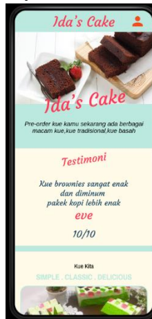
Gambar 4. Halaman Beranda

Halaman beranda website menampilkan berbagai macam kue dan juga pengalaman pelanggan yang pernah memesan sebelumnya.