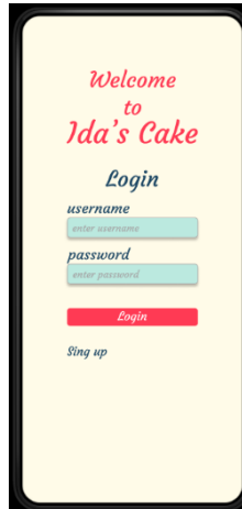
Gambar 3. Halaman Login

Layar pertama untuk mengunjungi website ini adalah halaman login, pengguna harus login terlebih dahulu untuk mengunjungi website.