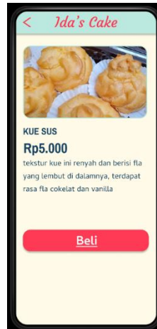
Gambar 5. Halaman Detail Kue

Pada halaman detail kue disini user dapat melihat deskripsi foto kue, harga kue per potong dan juga tombol (Beli) yang akan membawa user langsung ke WhatsApp penjual.